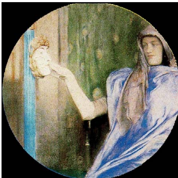
Fernand Knhopff, El Secreto (1902) (Museo Groening, Brujas)

En mis primeros pasos por la investigación histórica enfocada al estudio de la organización masónica me resultó sorprendente que la bibliografía sobre la sociedad “secreta” por antonomasia fuera de un volumen tan extraordinario. Una vez separado el grano de la paja, me di cuenta que en la historiografía autorizada se había solventado esta falsedad cambiando el adjetivo “secreta” por el de “discreta”, 1 así pues, se ha repetido en casi todas las obras de mayor calado científico que “la masonería no es secreta sino discreta”. Al principio,