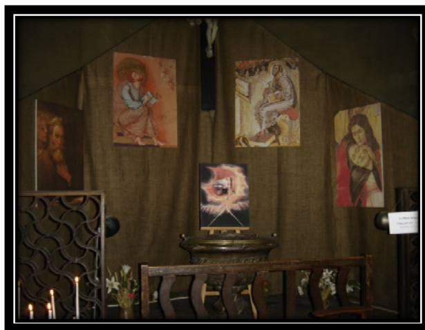
Imagen 1 Dios Creador de William Blake