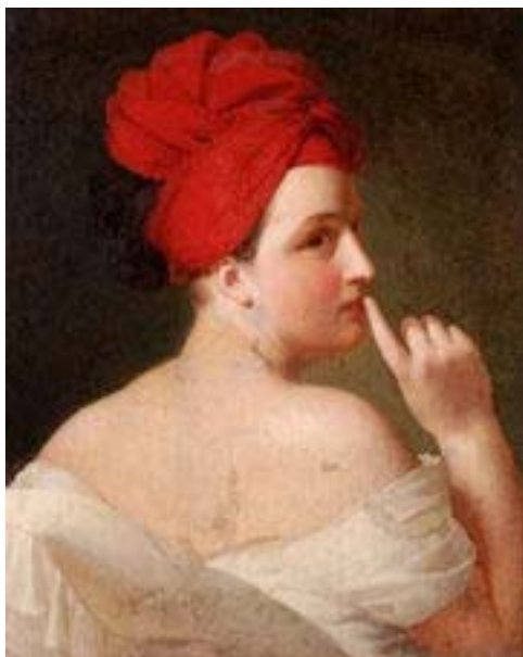
Claude Marie Dubufé, La Discreción (1820)